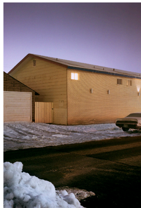
Todd Hido, #4124-c, 2018

House Hunting is an iconic series in Todd Hido's body of work. These photographs of suburban houses at night or in the early morning light were all taken in the United States. The subtle suggestion of human presence gives these images a theatrical quality. His photographs are part of numerous private and public collections, including the Getty, the Whitney Museum of American Art, and the San Francisco Museum of Modern Art. Pier 24 Photography holds the archives of all his published works.