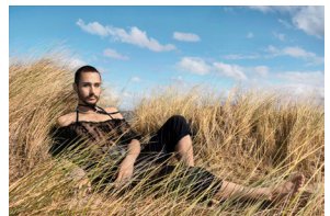
Scarlett Coten, Sacha , Dunkerque, France, 2022

Scarlett Coten is a French photographer renowned for her explorations of identity and masculinity through intimate portraits that challenge stereotypes and cultural expectations. Her artistic practice favors a documentary, immersive approach, enriched with a fictional dimension inspired by the cinematic universe, circumventing genre conventions particularly through her use of staging and carefully chosen, natural settings.