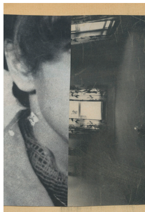
Katrien De Blauwer, Old sweater gets new uses (99) , 2024

In her photomontages, Katrien De Blauwer appropriates anonymous photographs, integrating them into her inner world and allowing viewers to recognize themselves, giving her narratives a universal dimension. Her work balances intimacy with the anonymity of found images. Her pieces are part of prestigious collections such as The Morgan Library Museum, the Museum of Fine Arts in Boston, and the National Bank of Belgium. In 2023, she was honored with a retrospective exhibition at the Rencontres d'Arles.