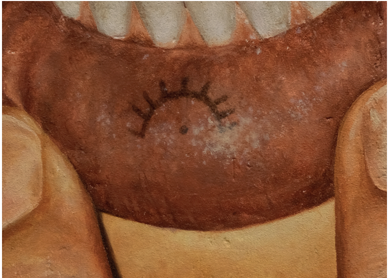
Jérémie Cosimi, Solaire , 2024, Huile sur bois, 6 x 8 cm

Pour sa première exposition à la galerie, du 5 septembre au 19 octobre 2024, L'artiste marseillais Jérémie Cosimi confronte avec dextérité ancestralité et contemporanéité dans une exposition intitulée Des soleils et des nuits .