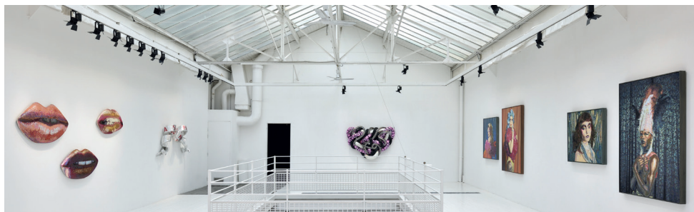
RUE DES FILLES-DU-CALVAIRE