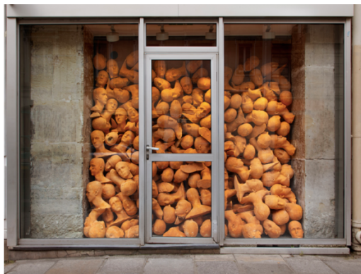
Vitrine in situ @2024

Pour « We do not remember », van Veluw transforme radicalement l'espace de la galerie. Dès l'entrée, le visiteur est accueilli par une installation troublante : 120 répliques de la tête de l'artiste, disposées de manière chaotique, semblent se presser et s'entrechoquer en une foule dense et aliénante. Une perspective perturbante qui pose immédiatement des questions sur l'identité et la répétition, dans une ambiance de confinement.