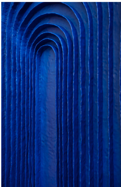
Perception-170 x 86cm / polymer clay-metal frame -2024

Qu'existe-t-il entre le passé et le présent ? Un lien souvent utilisé par la mémoire, qui agit comme un pont pour permettre à nos expériences passées d'influencer notre réalité actuelle. Une interaction qui peut être envisagée comme une sorte de dialogue continu entre ce que nous avons vécu et ce que nous vivons. La mémoire n'est pas qu'un enregistrement du passé, mais aussi un processus actif de reconstruction, de souvenirs filtrés, interprétés et parfois transformés par nos perceptions, émotions et besoins. Un passé dynamique plus que statique ; c'est le pari de Levi Van Veluw. « We do not remember » est revisité à travers le prisme du présent. Un mouvement actif dans l'art, où l'on retrouve des œuvres qui nous rappellent combien les souvenirs forgent l'identité ; entre réalité ou imaginaire, factuel ou réel, plusieurs questions subsistent quant à cette introspection de l'artiste.