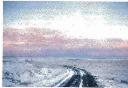
Todd Hido Jusqu'au 21 déc., à la galerie les Filles du calvaire.

Jusqu'au 5 jan. 2025, 11h-19h (sf lun.), Fondation Henri-Cartier-Bresson, 79, rue des Archives, 3 e , 01 40 61 50 50. (6-10€). 📖 Véritable expérience sensorielle, la découverte des photographies de Mame-Diarra Niang, née en 1982, donne l'impression de voir le réel se tordre, puis se dissoudre sous nos yeux. L'exposition se compose