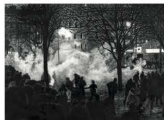
Manifestation 05, 2016. Fusain sur papier 54 x 76 cm. Courtesy Backslash.

J'utilise avec décontraction tous les moyens contemporains, dont la photographie, susceptibles de m'aider