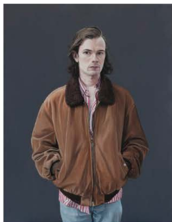
Pierre, 2016. Huile sur toile 116 x 88,5 cm.

Pas du tout ! C'est quelque chose qui se vit ! Peindre c'est d'abord un grand laisser-aller, même si le résultat a l'air très tenu. Passant parfois plusieurs mois à peindre une même toile, je me raconte tout au long de